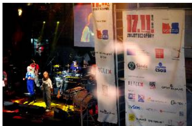
Vaše podpora bude vidět. Ukázka prezentace partnerů v projektech OPONY, o.p.s. v roce 2009.