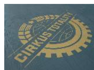
ProjektyOPONY, o.p.s. 2009/2010

Protože jsme nezávislou organizací, finanční prostředky na svou činnost a vývoj projektů generujeme především z grantů České republiky a Evropské unie. Nedílnou součástí našeho financování je ale také podpora komerčních subjektů a štědrých donátorů, kteří sdílejí naši vizi.