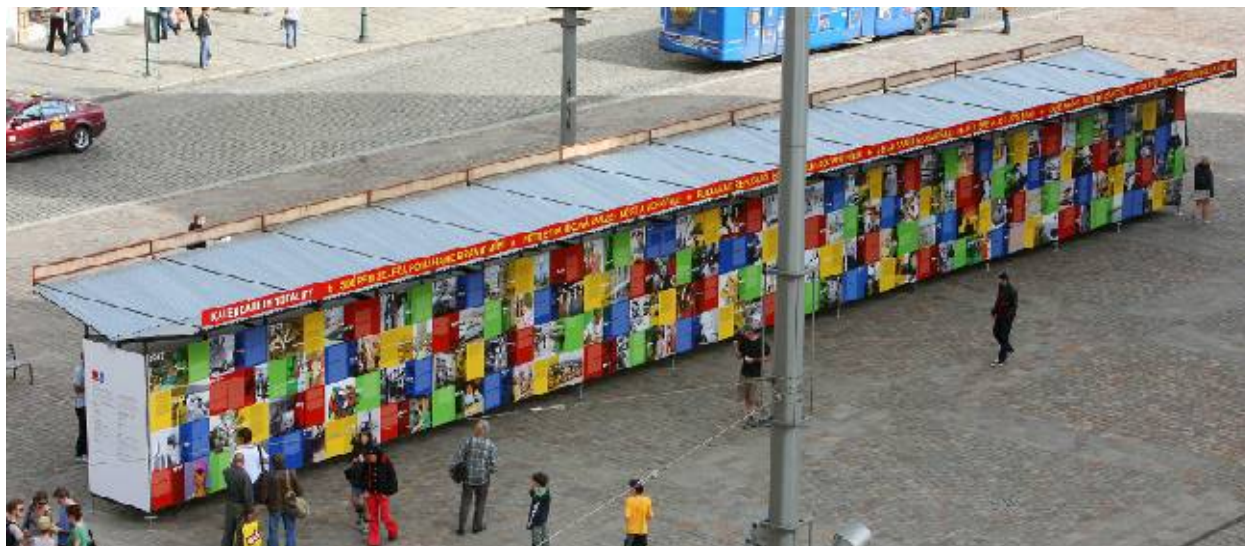
Kalendárium totality v Plzni

Originální putovní velkoformátová venkovní výstava