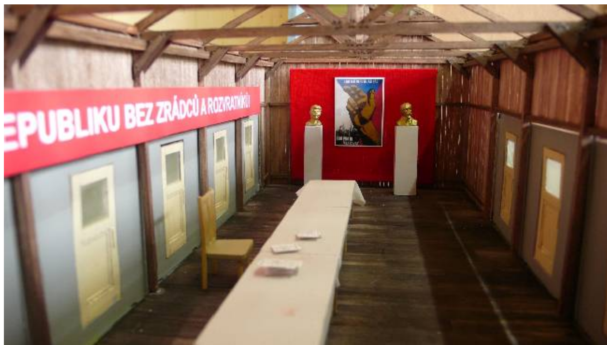
Model Trenažéru totality

profilu. Komise rozhoduje nahodile, její rozhodování je nevypočitatelné a nespravedlivé. Hráči dostávají lákavé nabídky za cenu ústupků v podobě vstupu do strany, udání apod. Ačkoliv každý postupuje sám ze sebe, skupiny se nemíchají a jednotlivci jsou neustále uvědomováni o tom, že se pohybují na určité společenské úrovni vyšší nebo nižší než ostatní a tuto úroveň mohou změnit pouze před kádrovou komisí.