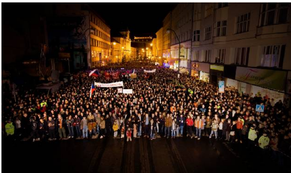
17. listopadu 2009, Praha - Národní třída

Jejím cílem v roce 2009 bylo především důstojně oslavit 20 let svobodného života v demokratické zemi a zároveň varovat před nástrahami totality a možnými formami jejího návratu. Projekty jsme realizovali zejména ve volném veřejném prostoru, aby byly dostupné co nejširší veřejnosti. Tak se s nimi v loňském roce setkal více než milión a půl lidí. Věříme tedy, že se nám vytyčený cíl podařilo naplnit.