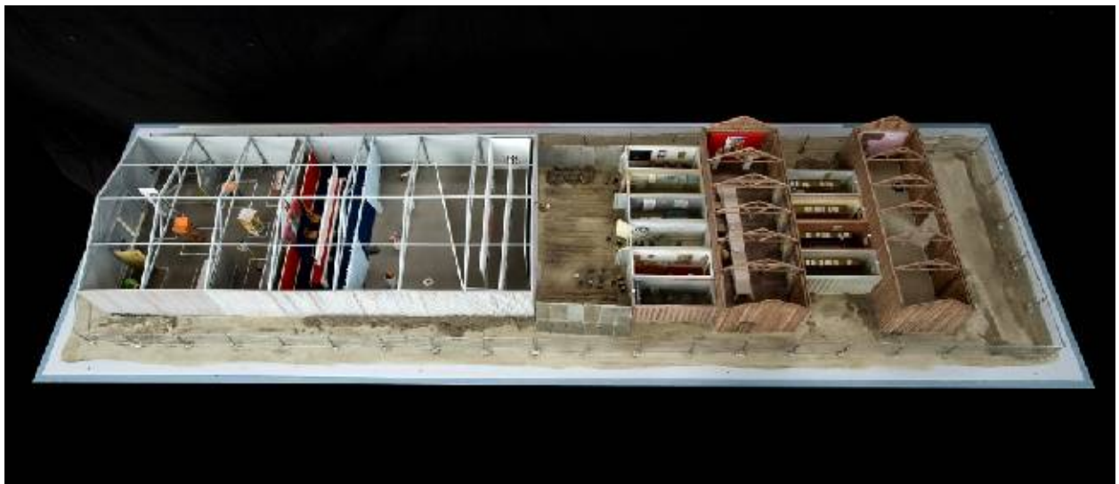
Model Trenažéru totality

V letech 2008 – 2009 jsme zpracovali tzv. koncepci „0“ , jež vyústila v realizaci modelu Trenažéru. Na modelu lze názorně ukázat a vysvětlit principy fungování expozice. Opona již model úspěšně představila v několika městech a institucích (Praha, Plzeň, Bratislava, Most; v Národním muzeu, Ústavu pro studium totalitních režimů, experimentálním prostoru Roxy/NoD ad.). Výstava modelu je i součástí projektu Futurama.