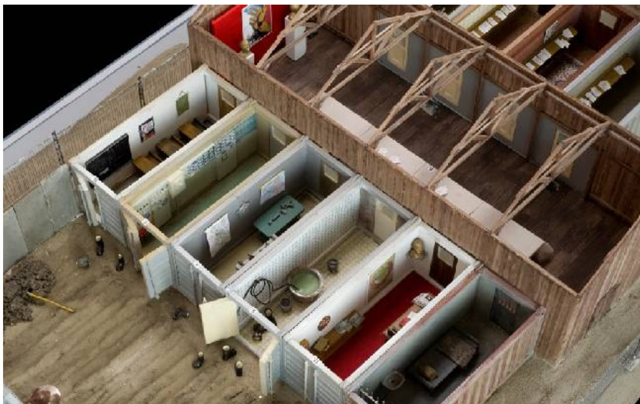
Model Trenažéru totality

které odpovídají jednotlivým časovým obdobím následovně: úvod do hry, poválečné období a předpoklady komunismu, 50. léta - budování komunismu, 60. léta - uvolnění, 1968 a normalizace a rok 1989. Každá část má specifické prostory, které spoluutváří atmosféru a odpovídají herním principům.